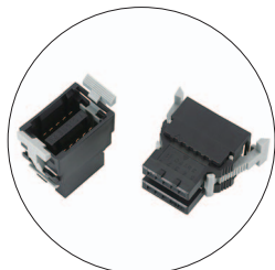
H型(2 to 2)